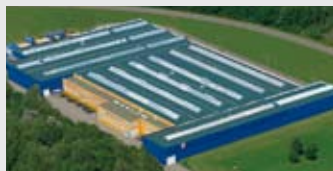
Hörmann KG Eckelhausen