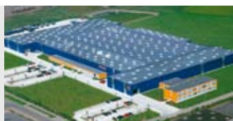
Hörmann KG Brandis