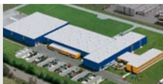
Hörmann KG Antriebstechnik