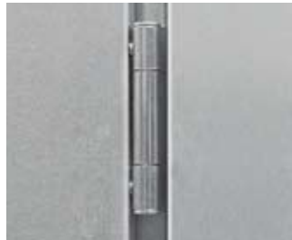
Kettő db 3-részes pánt horganyzott és karbantartásmentes a hosszú élettartam érdekében. Az ajtó előszerelt, így gyorsan beépíthető.