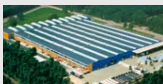
Hörmann Genk NV, Belgien