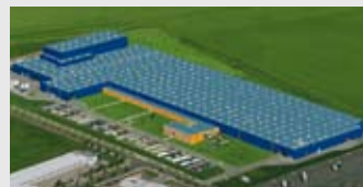
Hörmann KG Ichtershausen