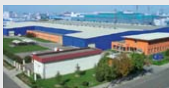
Hörmann Beijing, China