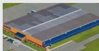
Hörmann Inc. Vonore TN, USA

A nemzetközi piacon egyedülállóan a Hörmann cég az, amely a fontosabb nyílászárók teljes palettáját kínálja. A termékeket szakosodott gyáregységekben, a legújabb műszaki megoldásokat alkalmazva gyártják. A siri európai értékesítési- és szervizhálózatnak, továbbá az amerikai és kínai képviselőnek köszönhetően mindenütt az Önök megbízható, nemzetközi partnerei vagyunk a nyílászárók piacán. Jelszavunk: Minőség kompromisszumok nélkül.