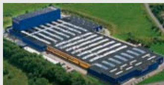
Hörmann KG Freisen