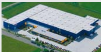
Hörmann KG Dissen