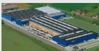
Hörmann KG Werne