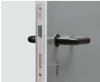
Műanyag kilincs acél maggal a tartós működés érdekében. Zár: hengerzárbetét