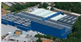
Hörmann KG Amshausen