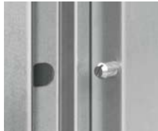
Kiemelégátló biztonsági csap, amely a pánntal ellentétes oldalról védi az ajtót a kiemelés ellen.

A Hörmann a helyszínhez igazítható ajtóként szállítja ezt a beépítésre kész ajtót. A szabadalmaztatott, csavarorsós gyorsrögzítésnek köszönhetően gyorsan beszerelhető. Amennyiben az építkezésen már nincs szükség az ajtóra, gyorsan és egyszerűen leszerelhető, majd újra felhasználható a következő helyszínen.