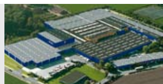
Hörmann KG Brockhagen